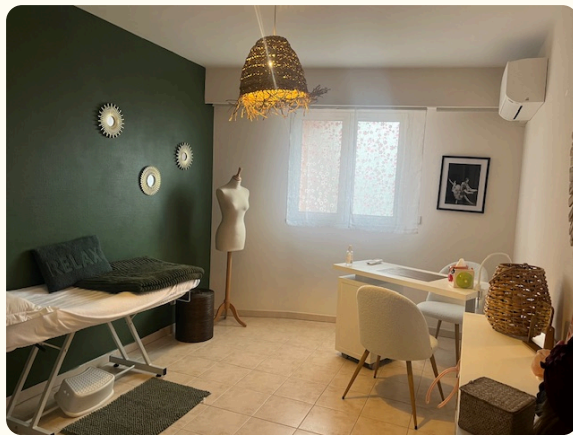
Nouvel aménagement des salles de soins

Grâce à nos généreux donateurs, nous avons pu embellir les salles de l'Espace Mieux-Être afin d'offrir à nos patients un lieu encore plus accueillant, propice au ressourcement et à l'accompagnement à travers nos soins de supports gratuits.