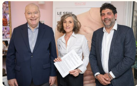
Signature de la convention avec le GEMLUC

Un joli cocon a pu être mis en place pour accueillir, toujours mieux, nos bénéficiaires.